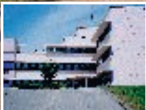
Le pareti esterne di questo ospedale sono state protette con Wall-Tech FP che crea una membrana resistente all'acqua e agli agenti chimici.