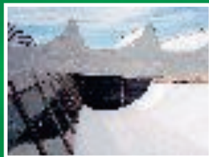
Tetto protetto con Thermo-Tech RG, rivestimento che riflette i raggi solari.