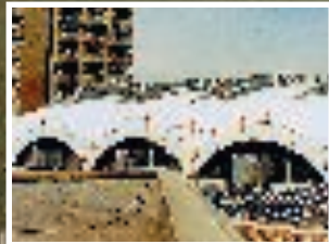
Tetto di un'autorimessa di autobus protetto con uno speciale tipo di Poly-Tech spruzzabile.