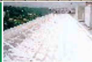
Tetto di un albergo protetto con Poly-Tech WG, rivestimento monocomponente liquido che si trasforma in membrana. Può essere applicato anche in inverno.