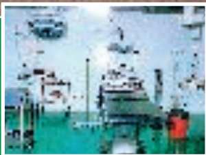
Rivestimento asettico a base d'acqua, Wall-Tech UV, applicato in questa sala operatoria. E' il prodotto ideale per proteggere tutte le aree igienico/sanitarie.