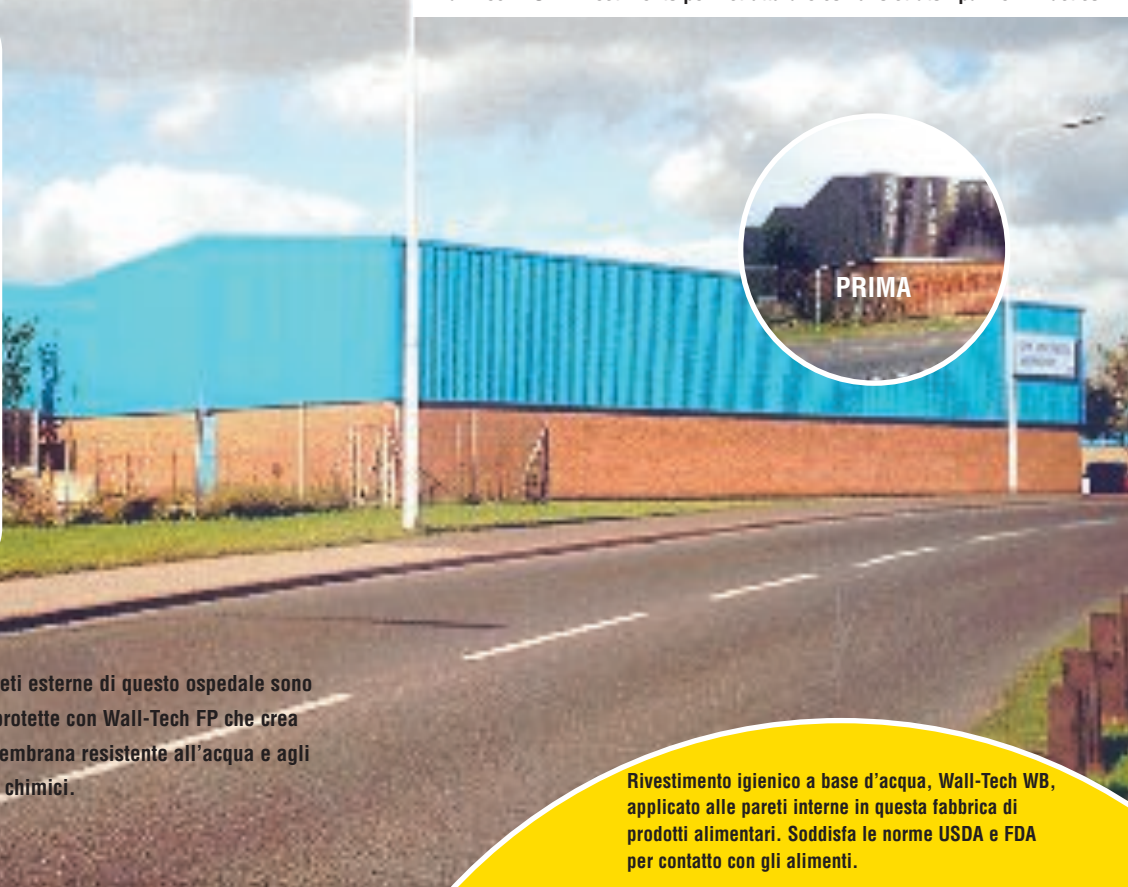
Wall-Tech PU – Rivestimento per ristrutturare con uno strato i pannelli Plastisol.

I Sistemi di protezione pareti Thortex sono ideali per qualunque superficie interna e esterna. Questi rivestimenti e rinzaffi vanno oltre le sempre più severe prescrizioni di legge, particolarmente quando l'aspetto igienico/sanitario è preminente.