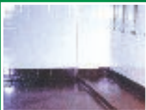
Piastrelle in ceramica incapsulate e protette con Wall-Tech WB nel locale docce di questa acciaieria.