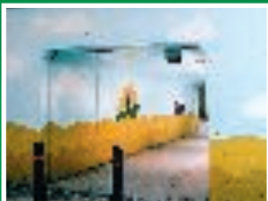
Le pareti di questo sottopassaggio pedonale sono protette con Uni-Tech UV, un rivestimento molto brillante anti-graffiti.